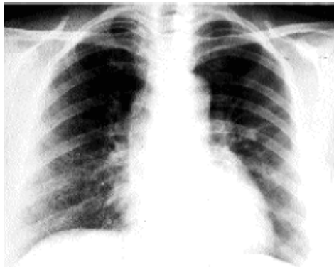
Figura 1. Rx. de tórax: Patrón intersticial difuso de predominio en campos pulmonares medios e inferiores

En febrero del 2008 refiere cuadro clínico caracterizado por tos seca sin predominio horario acompañado de disnea de moderados esfuerzos, fiebre no cuantificada, de predominio matutino, por lo cual consulta a médico privado, quien ordena antibióticos que no especifica, donde asiste en tres oportunidades, por igual sintomatología, sin resultados satisfactoria, debido a la persistencia de los síntomas (tos y disnea) y exacerbación de los mismos dado por cambio en el patrón de disnea a pequeños esfuerzos y expectoración amarillenta, es referida al servicio de neumonología donde es ingresada, el día 14 de abril del 2008 se le solicita Radiografía de tórax (ver figura 1).